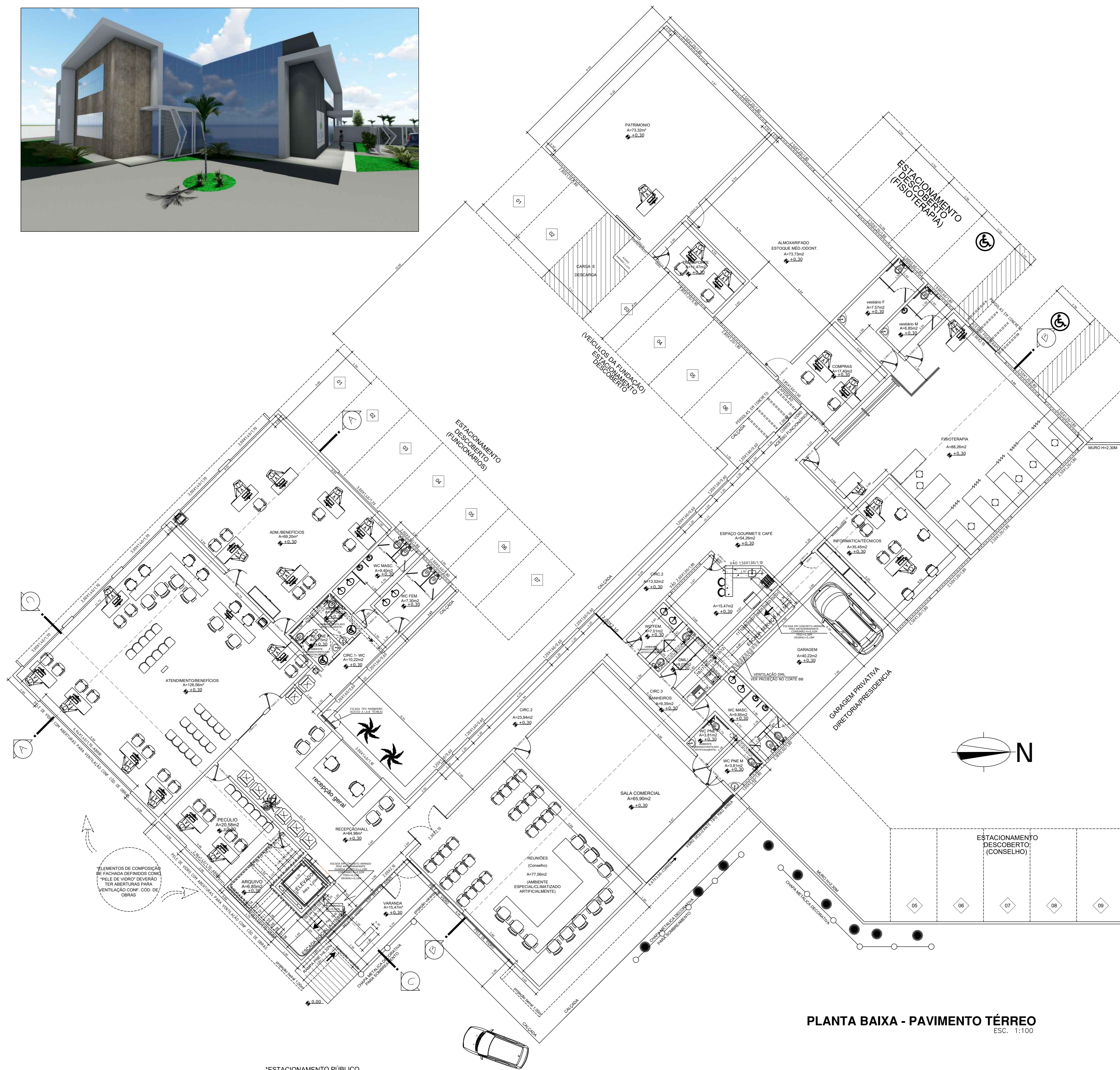
PLANTA BAIXA - PAVIMENTO TÉRREO ESC. 1:100

*ESTACIONAMENTO PÚBLICO VIDE PRANCHA IMPLANTAÇÃO